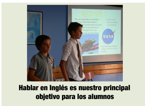
Hablar en Inglés es nuestro principal objetivo para los alumnos

Hablar en público, trabajos en equipo, Case Study y continua toma de decisiones. Impartido directamente por nuestra Fundació Escola Emprendors, entidad presente en las principales escuelas de Catalunya con nuestro programa Be an Entrepreneur .